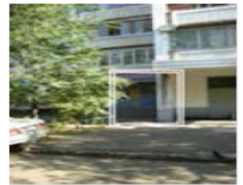
Рис. 4. Месторасположение парикмахерской

Собственнику желательно создать поток посетителей хотя бы 150 человек в неделю. Ассигнования, выделенные собственником на продвижение парикмахерской – не более 100 000 рублей. На той же улице четыре месяца назад открылась парикмахерская-конкурент на 4 посадочных места. Никаких услуг, кроме стрижки, не оказывают. Помещение крохотное, люди ждут своей очереди прямо в салоне. Работают 18-летние гастарбайтеры из Молдовы и Украины.